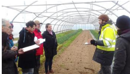
▲ Rencontre SPG, 2018, à Lyon

Ce projet, baptisé EATINGCRAFT, que l'on peut traduire par «Éducation en faveur de la création de réseaux d'alimentation alternative», bénéficie